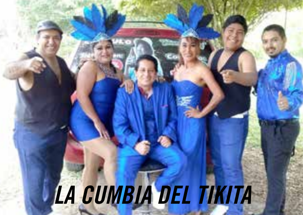
LA CUMBIA DEL TIKITA